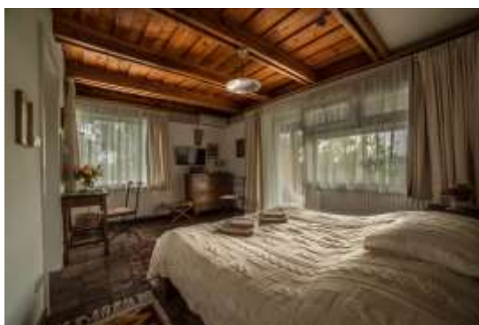
Káli Art Inn

A Káli-medencét sokan hívják Mini-Provence-nak, és ez a szálláshely pont erre játszik rá. És nagyon jól. Rusztikus mediterrán elemek keverednek a modern trendekkel, közben ügyesen becsempészi a magyar falusi hangulatot is. Mindezt varázslatos természeti környezetben.