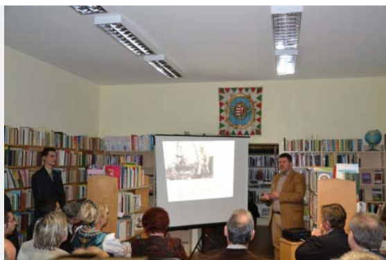
Az ünnepélyes átadón...